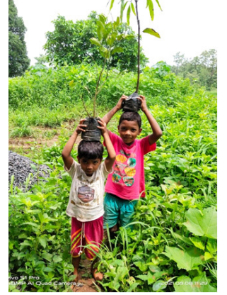
रोपं आणून देताना पिटेश्वरीतील बालमित्र

नारळ, आंबा, शेवगा, सुपारी, चिकू, अॅपल बोर, केळी (जळगावी वाण), सीताफळ, फणस, बंगला पान (नागवेल), मोसंबी, संत्रा, काजू, पेरू अशी १४ जातींची १७० रोपं गावकऱ्यां मध्ये वाटण्यात आली. निसर्गवेधतर्फे या गावात पहिल्यांदाच रोपं देण्यात आली. एकूण ८४ लोकांनी रोपांचा लाभ घेतला. प्रत्येक कुटुंबाला दोन झाडं उपलब्ध करून देण्यात आली.