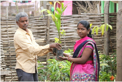
आमच्या रोपवाटिकेत काम करणारे सेवकभाऊ थाडेझरी गावात एका महिलेला रोपाची भेट देत आहेत.

आज सकाळी गावात छान प्रसन्न वातावरण होतं. प्रत्येक लाभार्थींचं संपूर्ण नाव आणि त्याला हवी असलेली दोन झाडं हा गृहपाठ आधीच केलेला असल्यामुळे एकूण काम सोपं झालं. तरीही रोपं गाडीतून उतरवल्यानंतर लोकांनी एकच कल्ला केला. मंडई भरावी, तशा आरडाओरड्याला उपस्थितांनी झाडी बोलीतील शेलक्या शिव्यांचा तडका दिला. जिथे तिथे कडमडणाऱ्या डगडग्या मुलांना आवरण्याचं काम एका उत्साही काकांनी केलं. गावात फळझाडांची रोपं मोफत वाटली जात आहेत ही बातमी सावरीची शेंग फुटावी तशी गावभर पसरली. झाडांसाठी नावनोंदणी करण्यात सुस्ती करणाऱ्या किंवा नावांची यादी तयार केली जात होती, तेव्हा बाहेर गेलेल्या लोकांनी त्यांची नावं दिली. पाहता पाहता ९३ लोकांची नवीन यादी तयार झाली. आता त्यांना सुमारे १९० रोपं वाटायची आहेत. (हा लेख तयार होऊन सगळ्यांना पाठवेपर्यंत झाडांचं वाटप झालेलं होतं.)