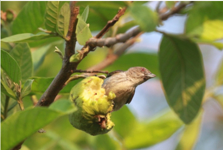
पिकलेल्या पेरूसाठी आलेला रेषाळ फुलटोचा

तो झाडाच्या फांद्यांवर उलटसुलट लटकत, वळसे मारल्यासारखा सरसरत, खाली-वर करत अशक्त जागा शोधून काढतो आणि किडीचा फडशा पाडतो. दुपारच्या वेळी मालकानं पाय जरा लांब केले की, टमटमीत पेरूंवर शाळूचोर हिरवे रावे उतरत आहेत. कधी समाधानाचे तर कधी लाडिक आवाज काढत कच्चेबच्चे, पाडाला आलेले आणि पिकलेले पेरू खात आहेत. पोपटांची धाड पडलेल्या अशा एखाद्या झाडाच्या भोवती पिकलेल्या पेरूंचा गंध भरून राहिलेला असतो. अर्धवट खाल्लेले, चोची लावलेले पेरू झाडाखाली पडलेले दिसतात. पेरूला फुलं आली रे आली की, फुलोरी मधमाश्यांची ये-जा सुरू होते.