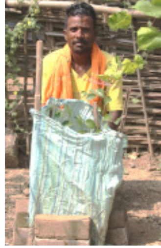
आतेगावातील एक नागरिक प्लास्टिकच्या पोत्याचा पुनर्वापर करून रोपाचं संरक्षण करतात

आतेगाव हे सुमारे ७५० वस्तीचं गाव वनखात्याच्या उमरझरी या क्षेत्रात येतं. मागच्या वर्षी, दिनांक १५ सप्टेंबर २०२० रोजी संस्थेतर्फे या गावात १०० रोपं वाटण्यात आली होती. त्यांपैकी ७५ रोपं लोकांनी